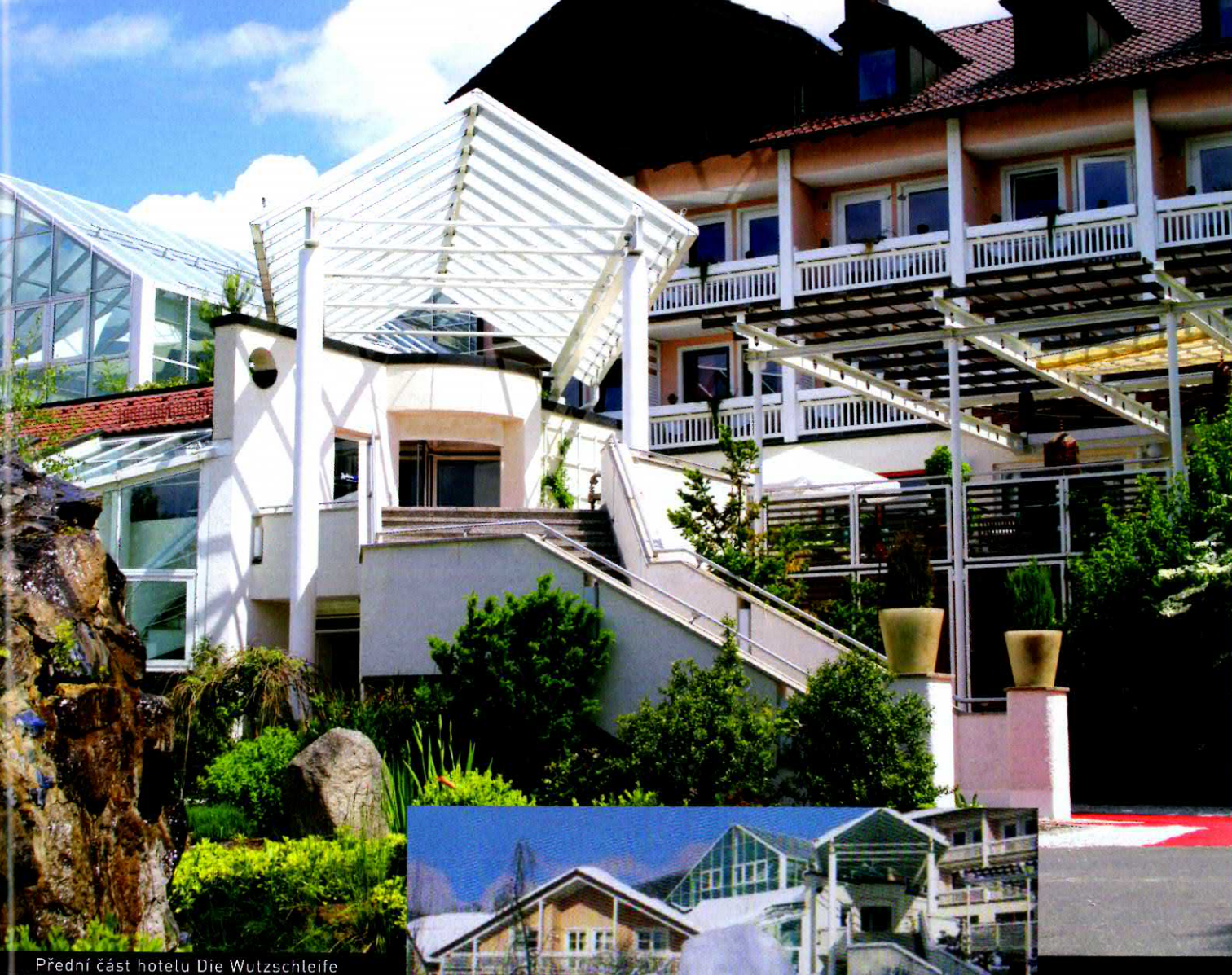
Přední část hotelu Die Wutzschleife