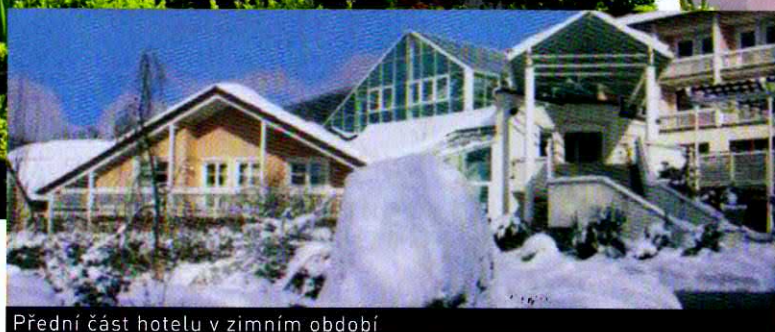
Přední část hotelu v zimním období

Die Wutzschleife Das Gefühl frei zu sein RESORT