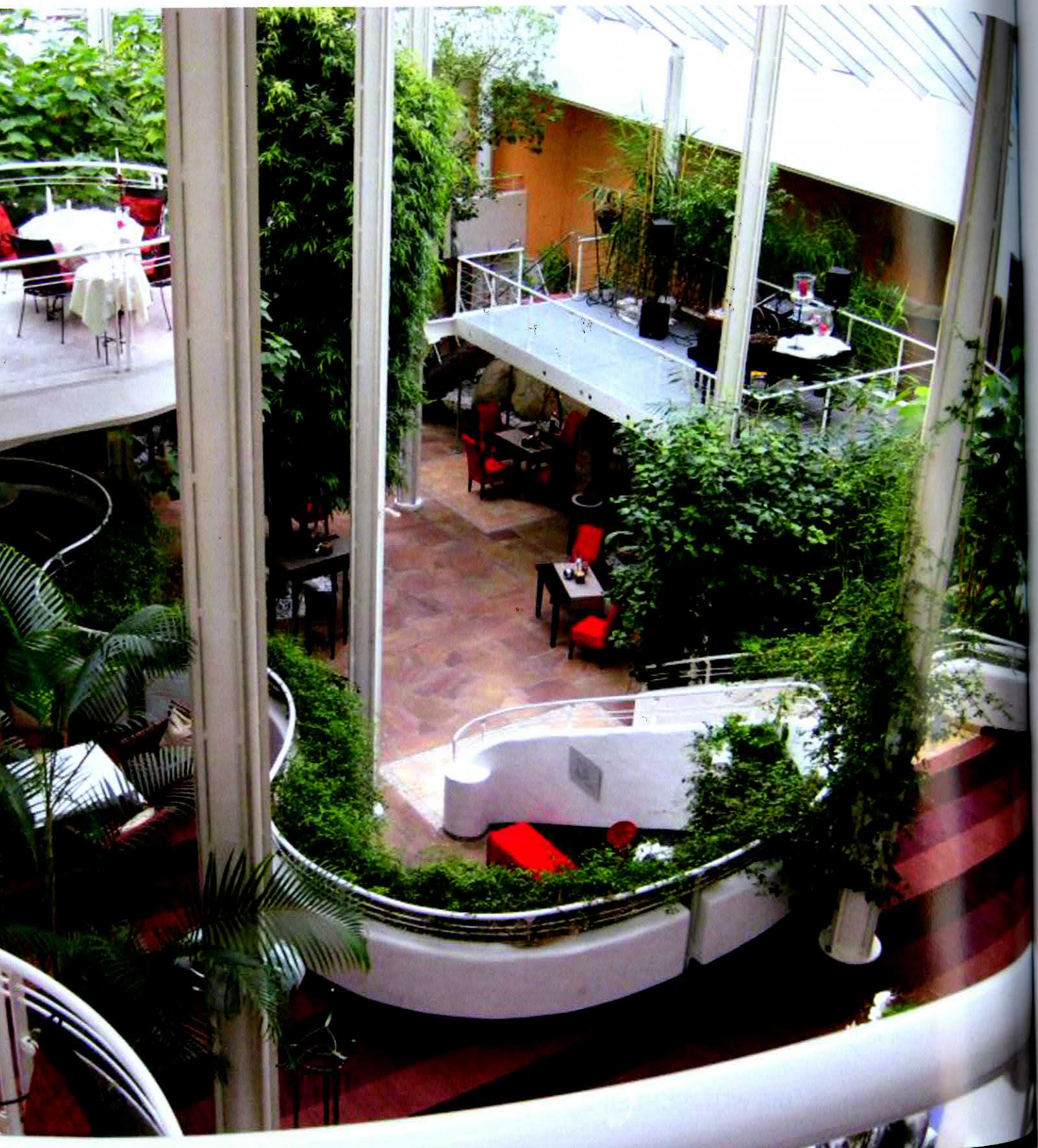
Vnitřní nádhera hotelu