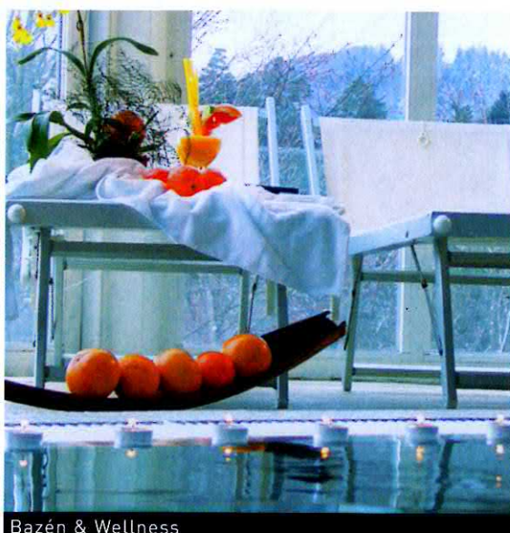
Bazén & Wellness